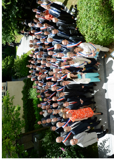
Autour du Président de l'AMF, François Baroin, les maires sont engagés pour la lecture.

Le Label « Ma commune / Mon interco aime lire et faire lire », créé par l'association Lire et faire lire en partenariat avec l'Association des maires de France (AMF), met en avant les collectivités locales les plus engagées dans ce partenariat avec Lire et faire lire.